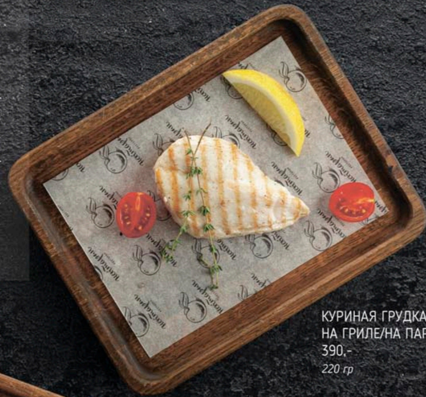
КУРИНАЯ ГРУДКА НА ГРИЛЕ/НА ПАРУ 390,- 220 гр