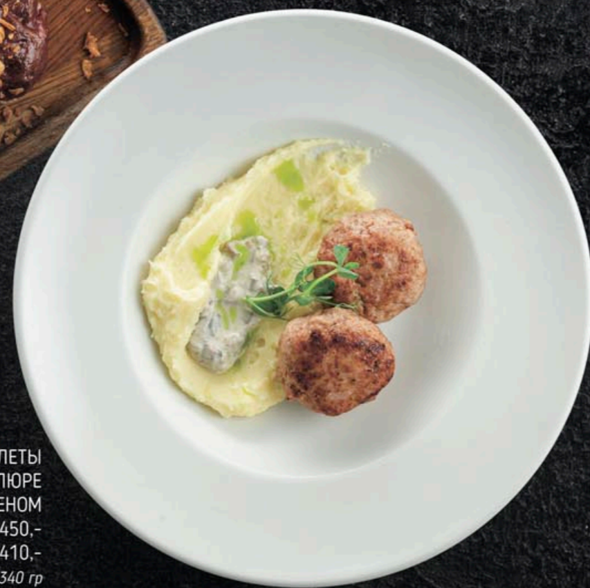
КОТЛЕТЫ С КАРТОФЕЛЬНЫМ ПЮРЕ И ГРИБНЫМ ЖУЛЬЕНОМ Мясные 450,- Куриные 410,- 340 гр