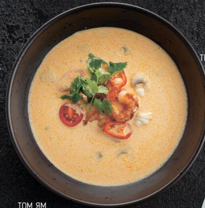
ТОМ ЯМ 590,- 300 мл