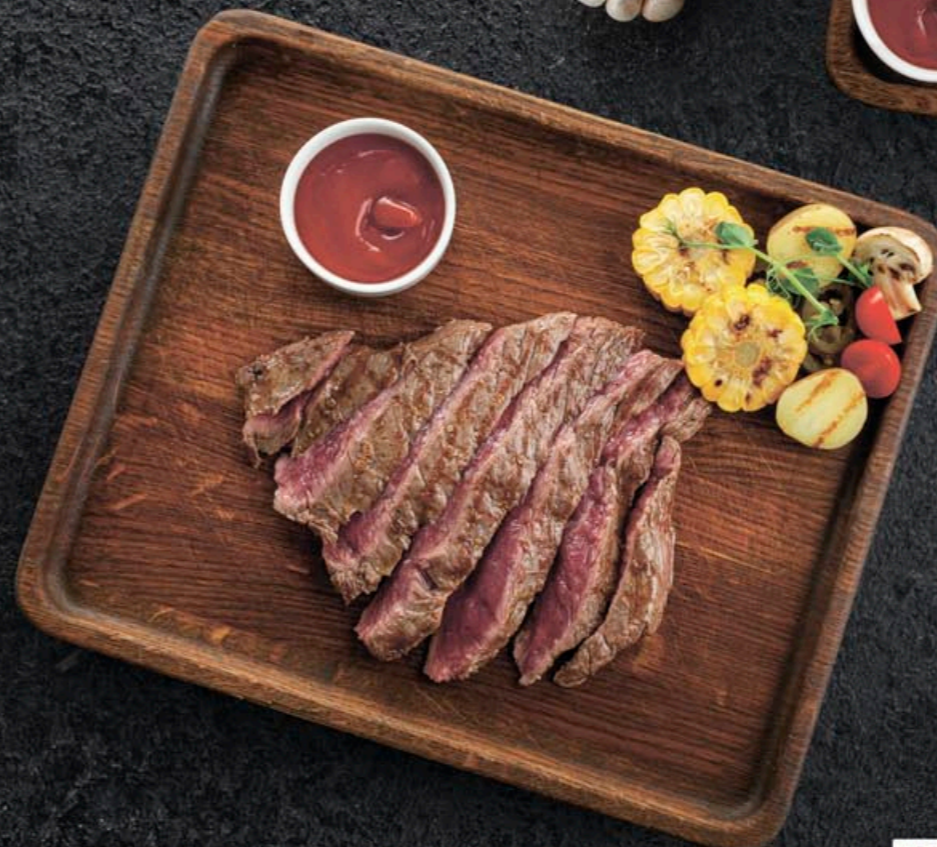
СТЕЙК ФЛАНК С ОВОЩАМИ ГРИЛЬ 890,- 300 гр