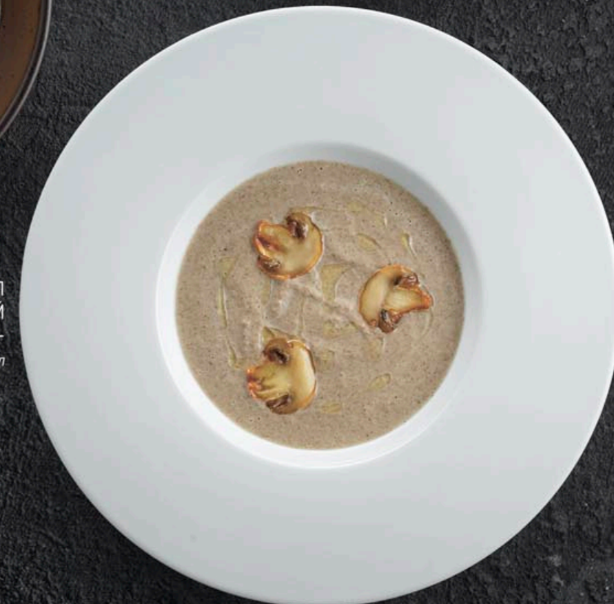
КРЕМ-СУП ГРИБНОЙ 360,- 320 мл