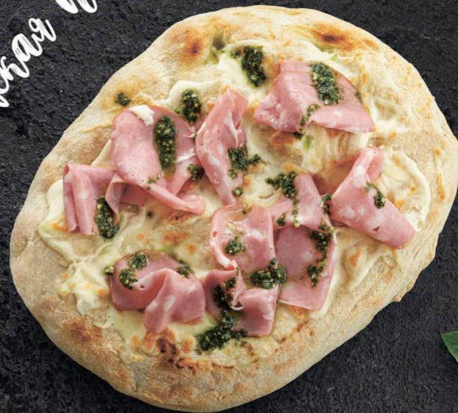
ПИЦЦА С МОРТАДЕЛЛОЙ И СОУСОМ ПЕСТО 460,- 250 гр