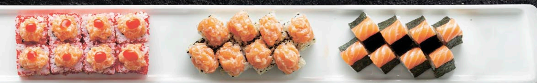
ОСТРЫЙ РОЛЛ С ЛОСОСЕМ 470,-