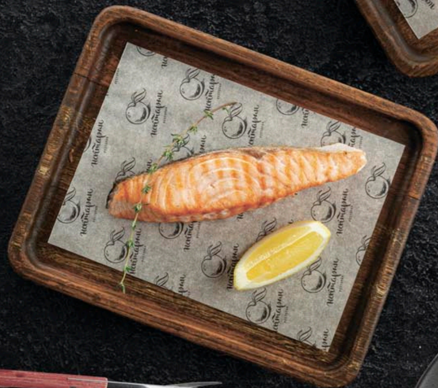
ЛОСОСЬ НА ГРИЛЕ/НА ПАРУ 860,- 130 гр