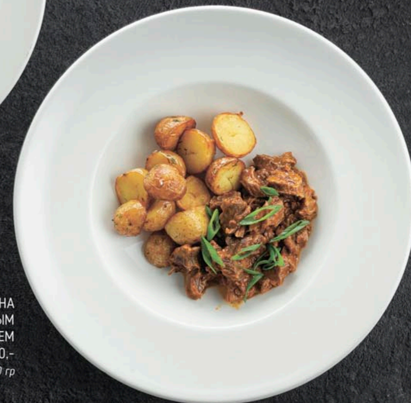
ТУШЕНАЯ ГОВЯДИНА С МОЛОДЫМ ПЕЧЕНЫМ КАРТОФЕЛЕМ 610,- 400 гр