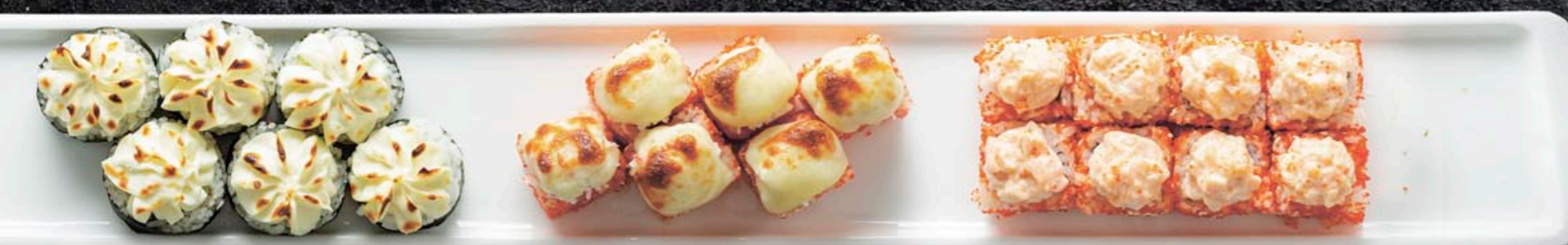
ЗАПЕЧЁННЫЙ С УГРЁМ 560,-