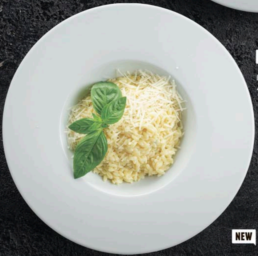
ОРЗО ЧЕТЫРЕ СЫРА 410,- 190 гр