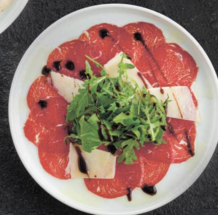
КАРПАЧО ИЗ ГОВЯДИНЫ С ГРАНА ПАДАНО И РУККОЛОЙ 450,- 90 гр