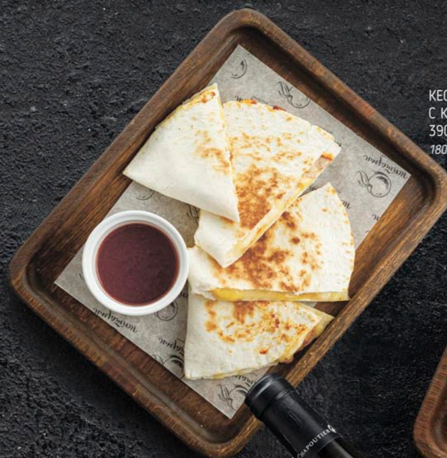
КЕСАДИЛЬЯ С КУРИЦЕЙ 390,- 180 гр