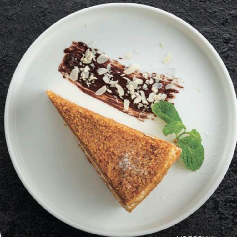
МЕДОВИК 330,- 150 гр