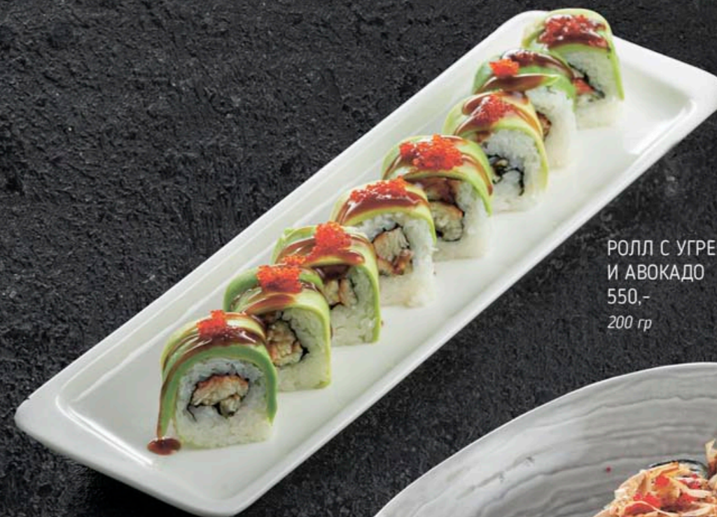
РОЛЛ С УГРЕМ И АВОКАДО 550,- 200 гр