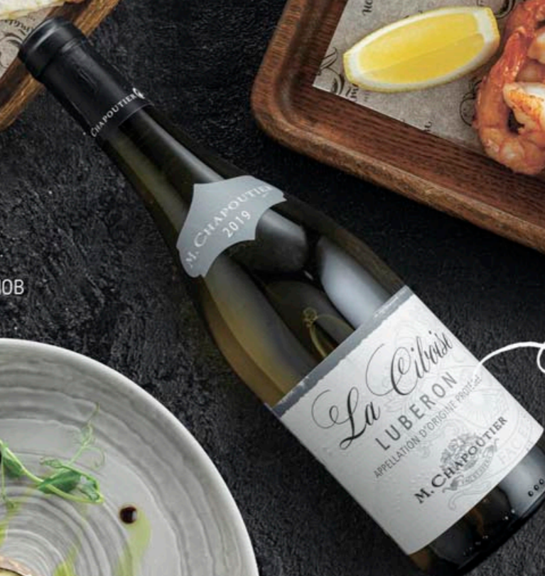
М. ШАПУТЬЕ, "ЛЯ СИБУАЗ" РУЖ 2800,- M. Chapoutier, "La Ciboise" Rouge, Luberon Франция, Долина Роны, Кот дю Люберон Крепость 13,5%, белое вино

Вино превосходно дополнит практически любые блюда, особенно хорошо сочетается с блюдами, приготовленными на гриле.