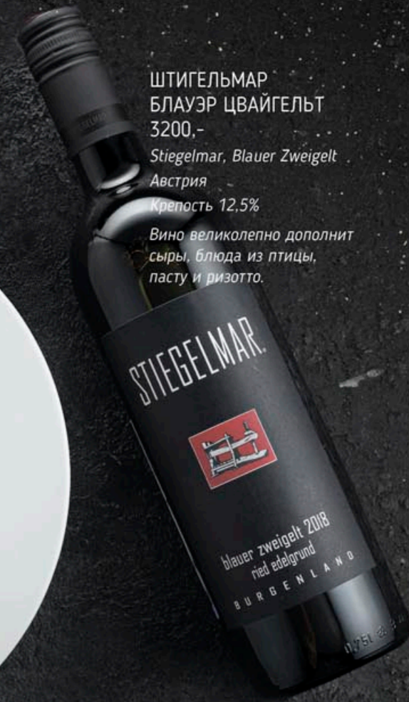
ШТИГЕЛЬМАР БЛАУЭР ЦВАЙГЕЛЬТ 3200,- Stiegelmar, Blauer Zweigelt Австрия Крепость 12.5% Вино великолепно дополнит сыры, блюда из птицы, пасту и ризотто.