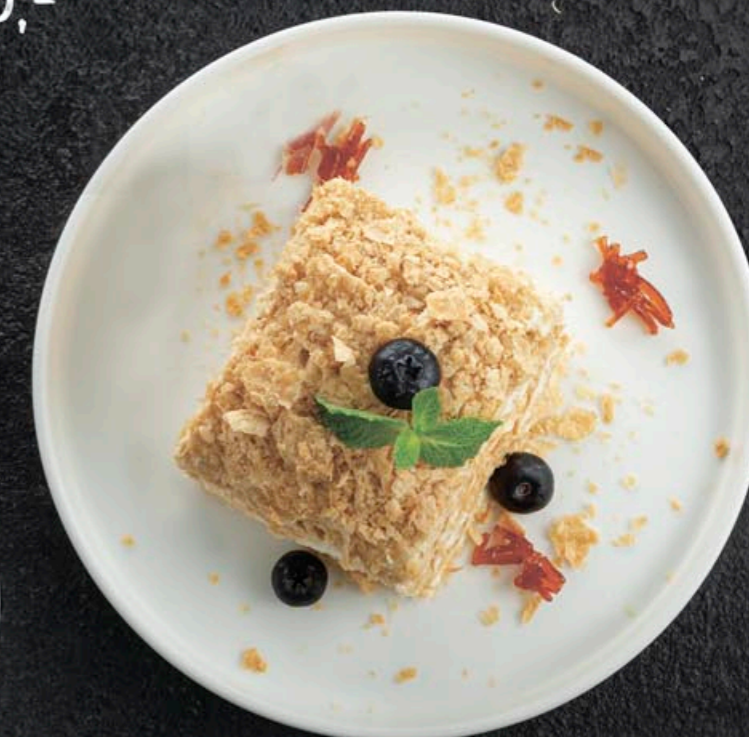
НАПОЛЕОН 330,- 150 гр