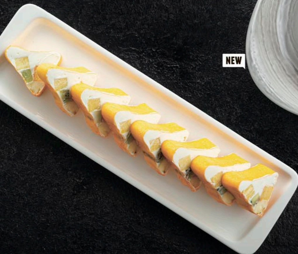
ФРУКТОВЫЙ РОЛЛ 410,- 250 гр