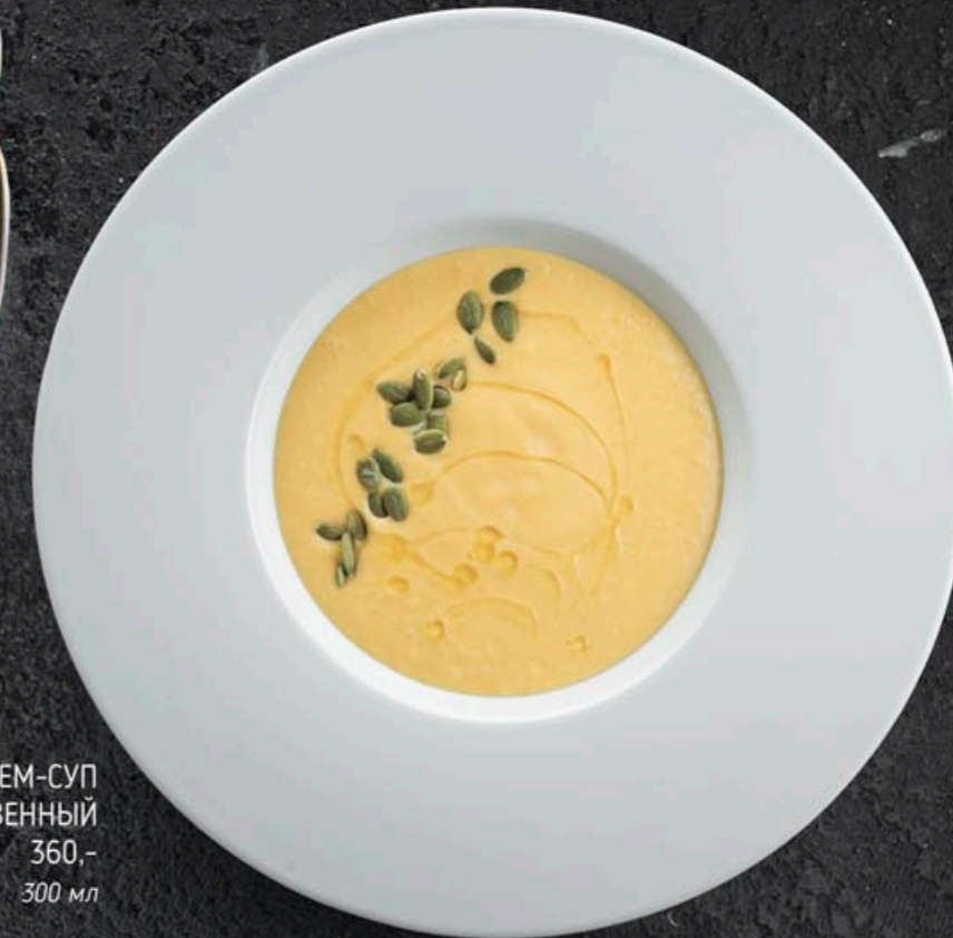
КРЕМ-СУП ТЫКВЕННЫЙ 360,- 300 мл