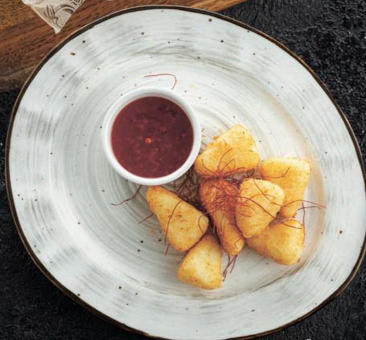
ЖАРЕННЫЙ СЫР С СОУСОМ СЛАДКИЙ ЧИЛИ/ ЯГОДНЫМ КОНФИТЮРОМ 350,- 180 гр