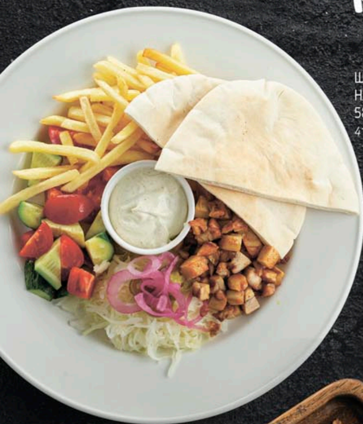
ШАВЕРМА НА ТАРЕЛКЕ 580,- 410 гр