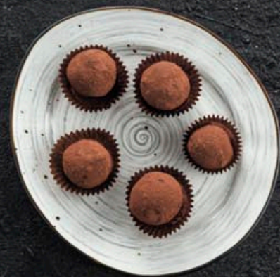
ДОМАШНИЕ КОНФЕТЫ 1 шт. - 40,- 15 гр

Мы можем испечь торт специально к Вашему мероприятию. Украшение торта может быть любым, на ваш вкус.