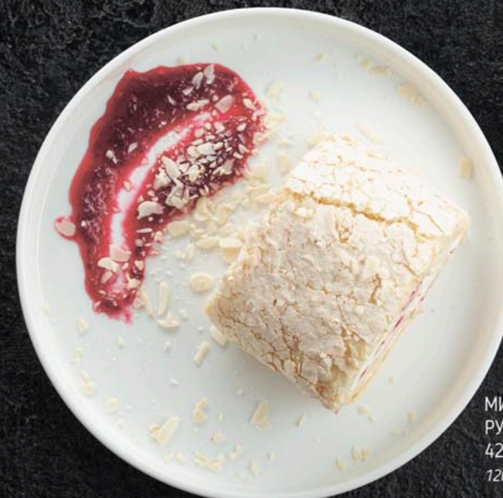
МИНДАЛЬНЫЙ РУЛЕТ С МАЛИНОЙ 420,- 120 гр