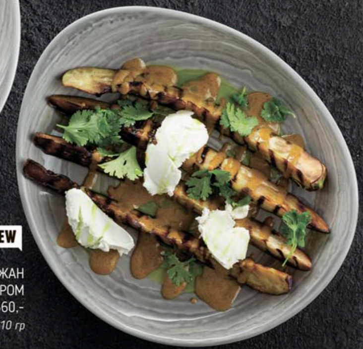
ПЕЧЕННЫЙ БАКЛАЖАН С ЧЕСНОКОМ И МЯГКИМ СЫРОМ 360,- 210 гр