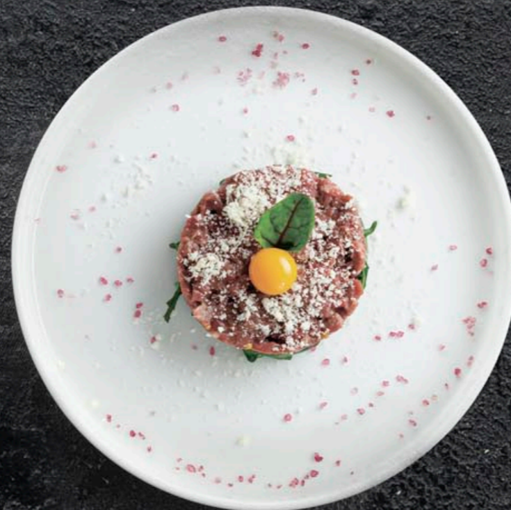
ТАРТАР ИЗ ГОВЯДИНЫ С РУККОЛОЙ И ПАРМЕЗАНОМ (Подаем с ржаным хлебом) 490,- 170 гр