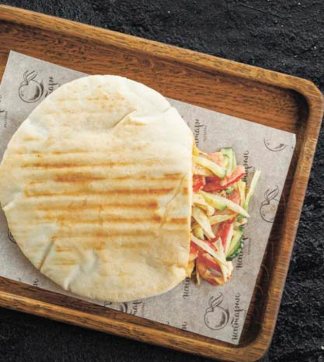
ШАВЕРМА В ПИТЕ 470,- 280 гр