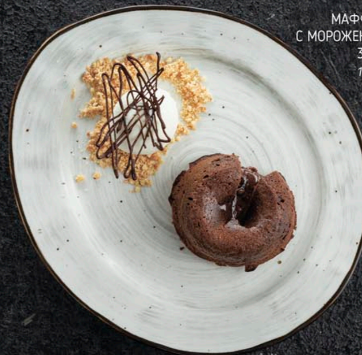
МАФФИН С МОРОЖЕНЫМ 370,- 180 гр