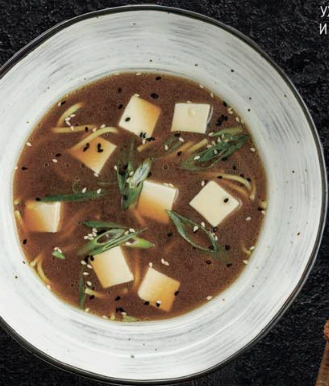
МИСО СУП 250,- 300 мл