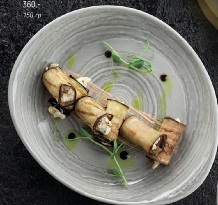
РУЛЕТКИ ИЗ БАКЛАЖАНОВ ПО-ГРУЗИНСКИ 360,- 150 гр