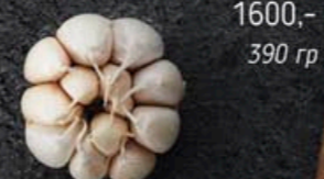
1600,- 390 гр