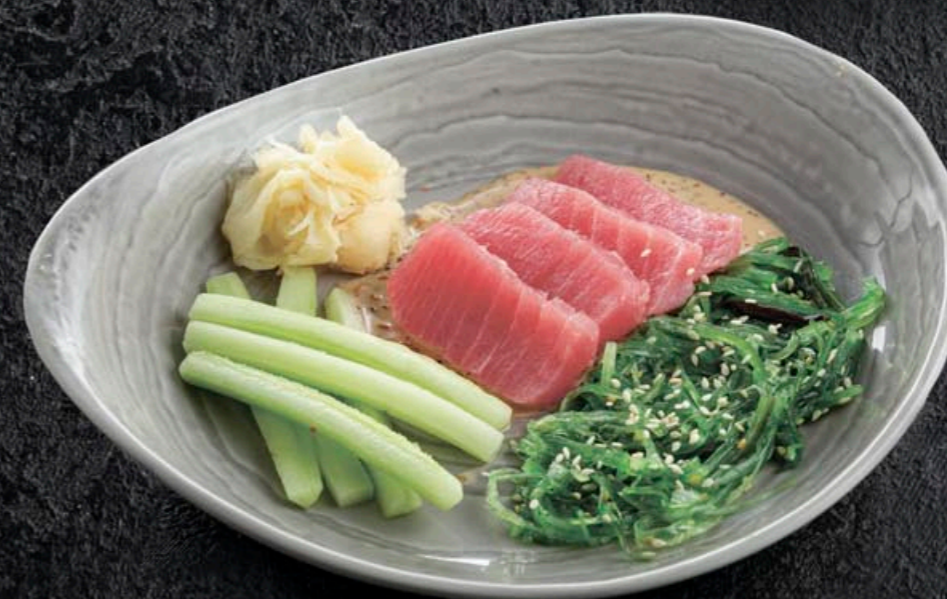
САШИМИ С ТУНЦОМ 380,- С ЛОСОСЕМ 380,- С УГРЕМ 490,- 180 гр