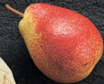
ПИЦЦА ЧЕТЫРЕ СЫРА С ГРУШЕЙ 460,- 280 гр