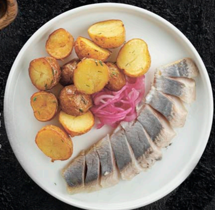
СЕЛЬДЬ С ЗАПЕЧЕННЫМ КАРТОФЕЛЕМ 390,- 260 гр

Вино превосходно дополнит практически любые блюда, особенно хорошо сочетается с блюдами, приготовленными на гриле.