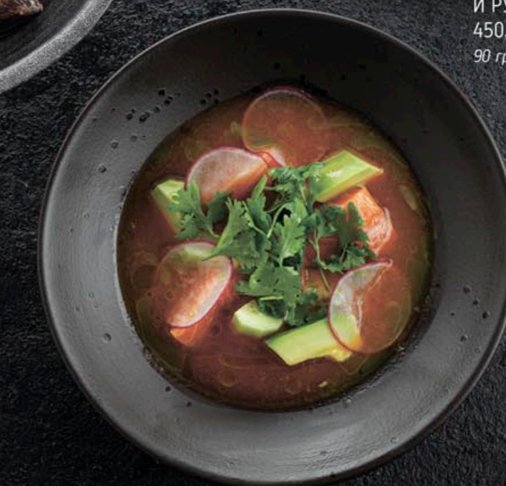
СЕВИЧЕ ИЗ ЛОСОЯ С УСТРИЧНЫМ СОУСОМ 490,- 160 гр

Вино обладает универсальным характером и может сочетаться с широким спектром блюд, особенно хорошо с ростбифом и морепродуктами.