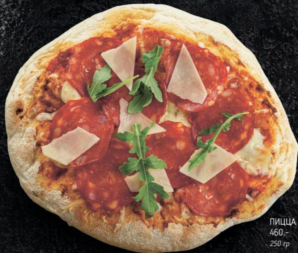
ПИЦЦА САЛЬЧИЧОН 460,- 250 гр