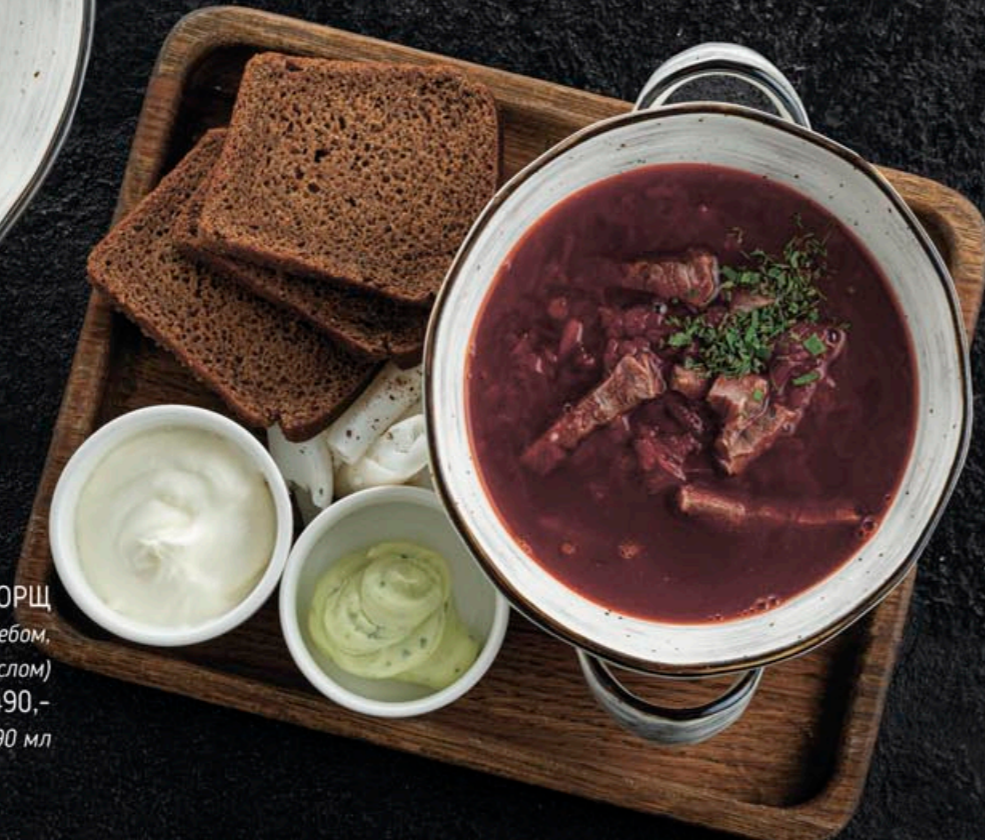
ДОМАШНИЙ БОРЩ (Подается с салом, ржаным хлебом, сметаной и зеленым маслом) 490,- 490 мл