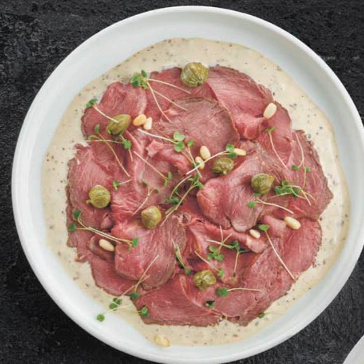
ВИТЕЛЛО ТОННАТО С КАПЕРСАМИ 450,- 120 гр