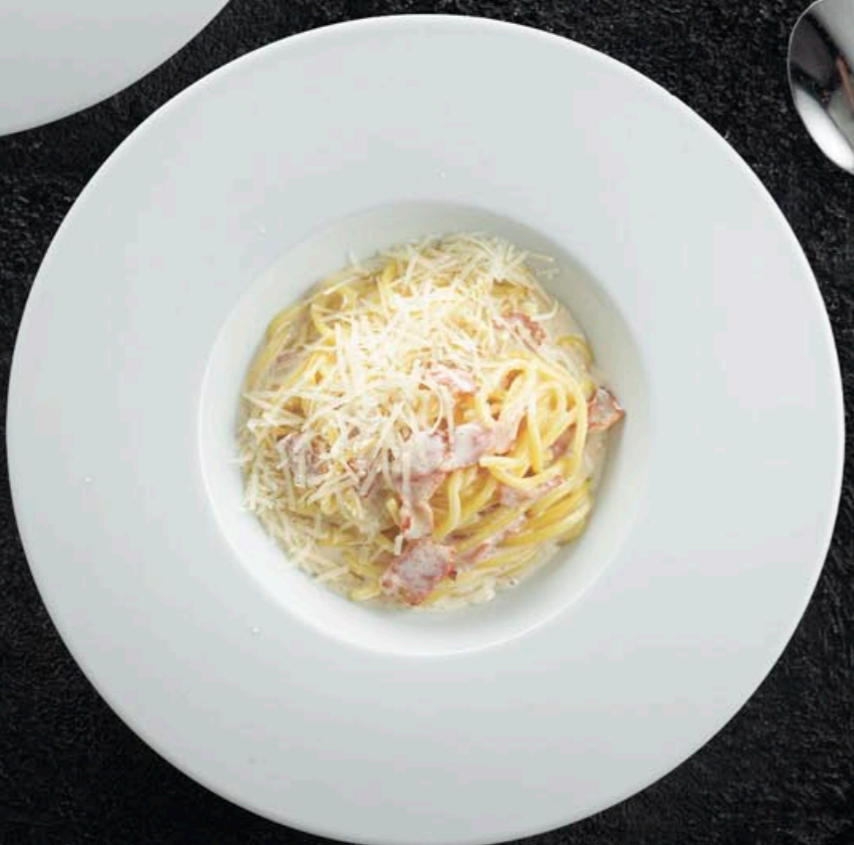
СПАГЕТТИ КАРБОНАРА 490,- 260 гр