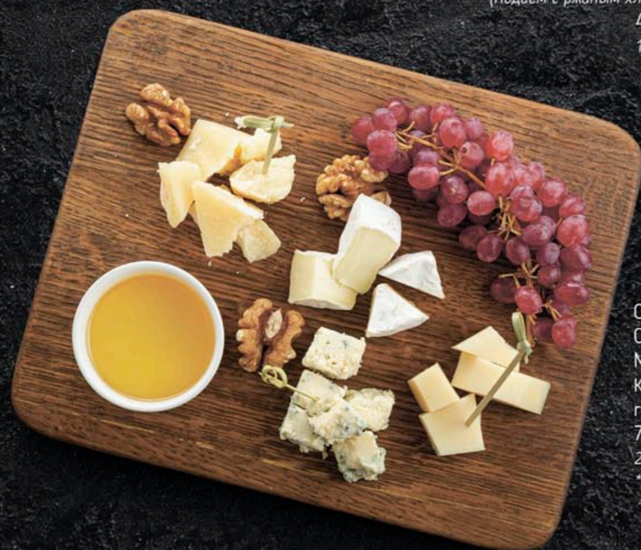
СЫРНАЯ ТАРЕЛКА С ВИНОГРАДОМ, МЕДОМ И ОРЕШКАМИ* Камамбер, горгондзола, грана падано, пармезан 790,- 275 гр *Уточняйте у официанта