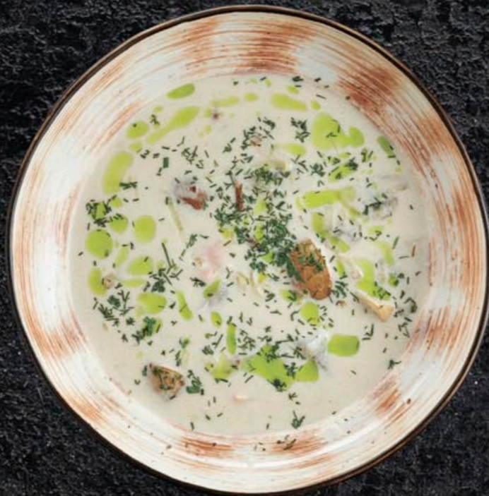
УХА С СОУСОМ БЕШАМЕЛЬ И ПЕЧЕНЫМ КАРТОФЕЛЕМ 490,- 270 мл