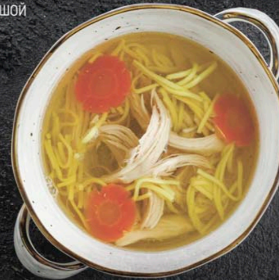
КУРИНЫЙ БУЛЬОН С ЛАПШОЙ 350,- 330 мл