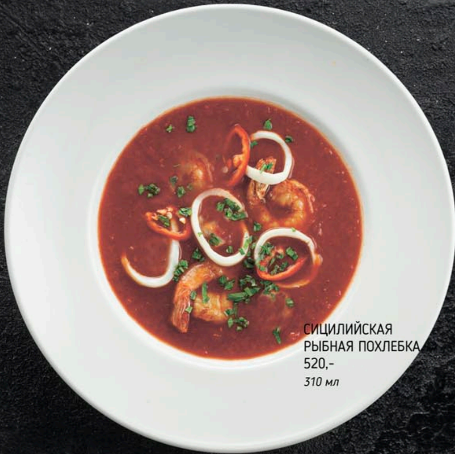
СИЦИЛИЙСКАЯ РЫБНАЯ ПОХЛЕБКА 520,- 310 мл