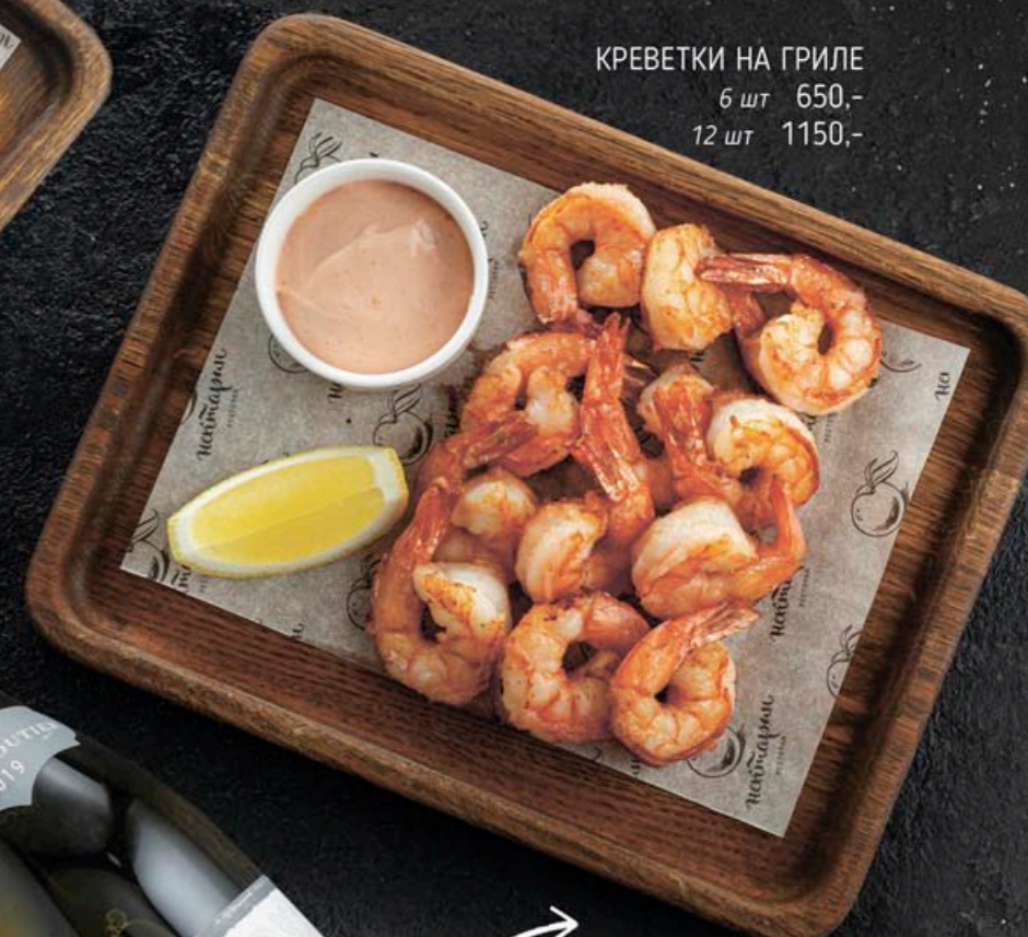
КРЕВЕТКИ НА ГРИЛЕ 6 шт 650,- 12 шт 1150,-