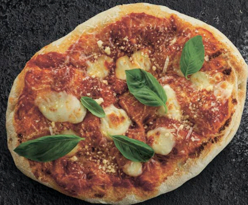
ПИЦЦА МАРГАРИТА 400,- 230 гр