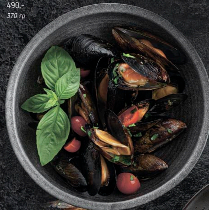
СОТЕ ИЗ МИДИЙ 490,- 370 гр