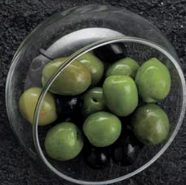
ОЛИВКИ/МАСЛИНЫ 230,- 50 гр