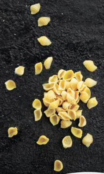
ПАПАРДЕЛЛЕ С ЛОСОСЕМ В СЛИВОЧНО-ИКОРНОМ СОУСЕ 590,- 260 гр