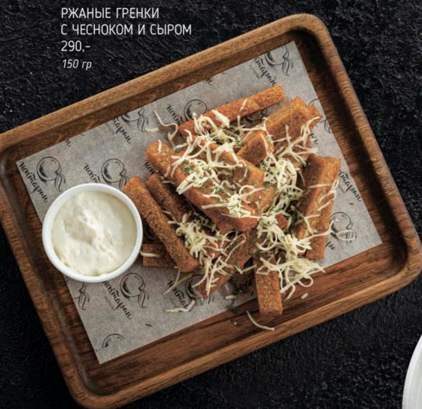
РЖАНЫЕ ГРЕНКИ С ЧЕСНОКОМ И СЫРОМ 290,- 150 гр