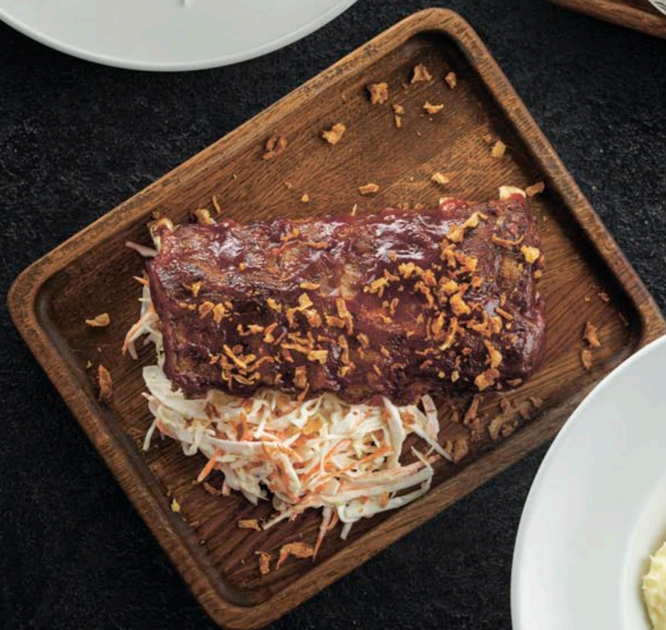
СВИНЫЕ РЕБРЫШКИ ВВQ С КОУЛ СЛОУ 690,- 430 гр