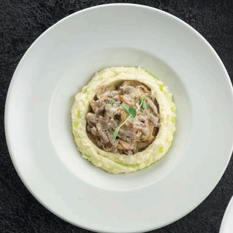
БЕФСТРОГАНОВ С КАРТОФЕЛЬНЫМ ПЮРЕ 750,- 390 гр